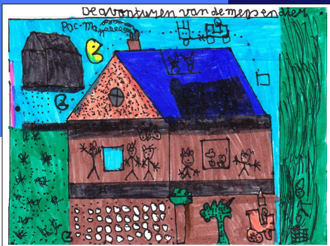
Tekening: Kristian Honebecke